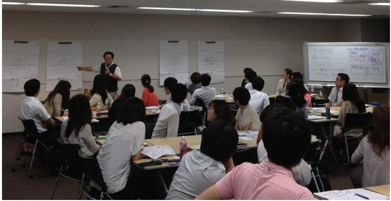
仮想会社を作って実習スタート

2013年7月24日(水)-25日(木)に、強いブランド、新ジャンルを創造するコンセプト発想法「キーニーズ法」セミナーが開催されました。7チームに分かれて、潜在ニーズの発掘～未充足ニーズ創造～天才コンセプト完成までを実習しました。