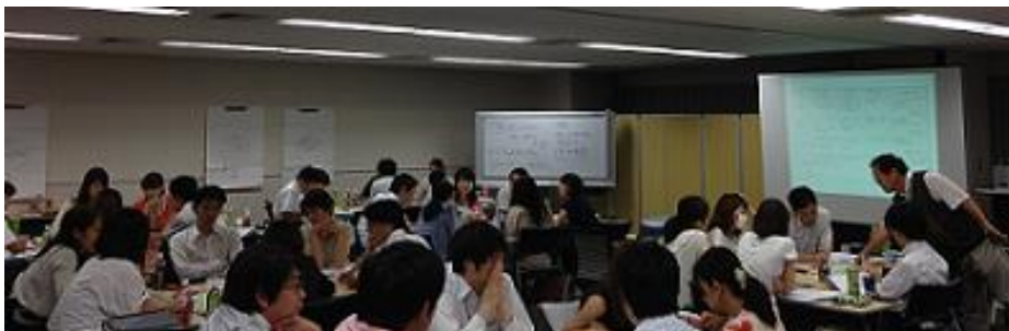
実習のモットーは、楽しく熱心に！